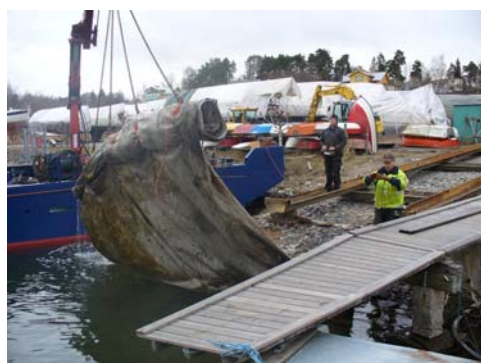
4 april: Geo-matta sjösätts